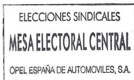
Por CCP Jesús Mayor Monzón